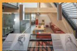
Dehlingen : CIP la Villa