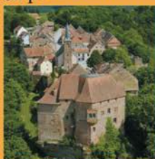
La Petite Pierre: maison du Parc

Profitez-en pour découvrir les richesses de l'Alsace Bossue