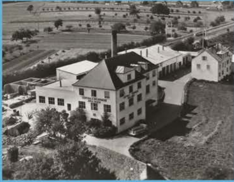
Drulingen Maison des Services (ancienne centrale beurrière)